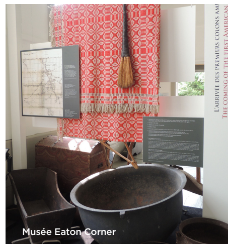
Musée Eaton Corner