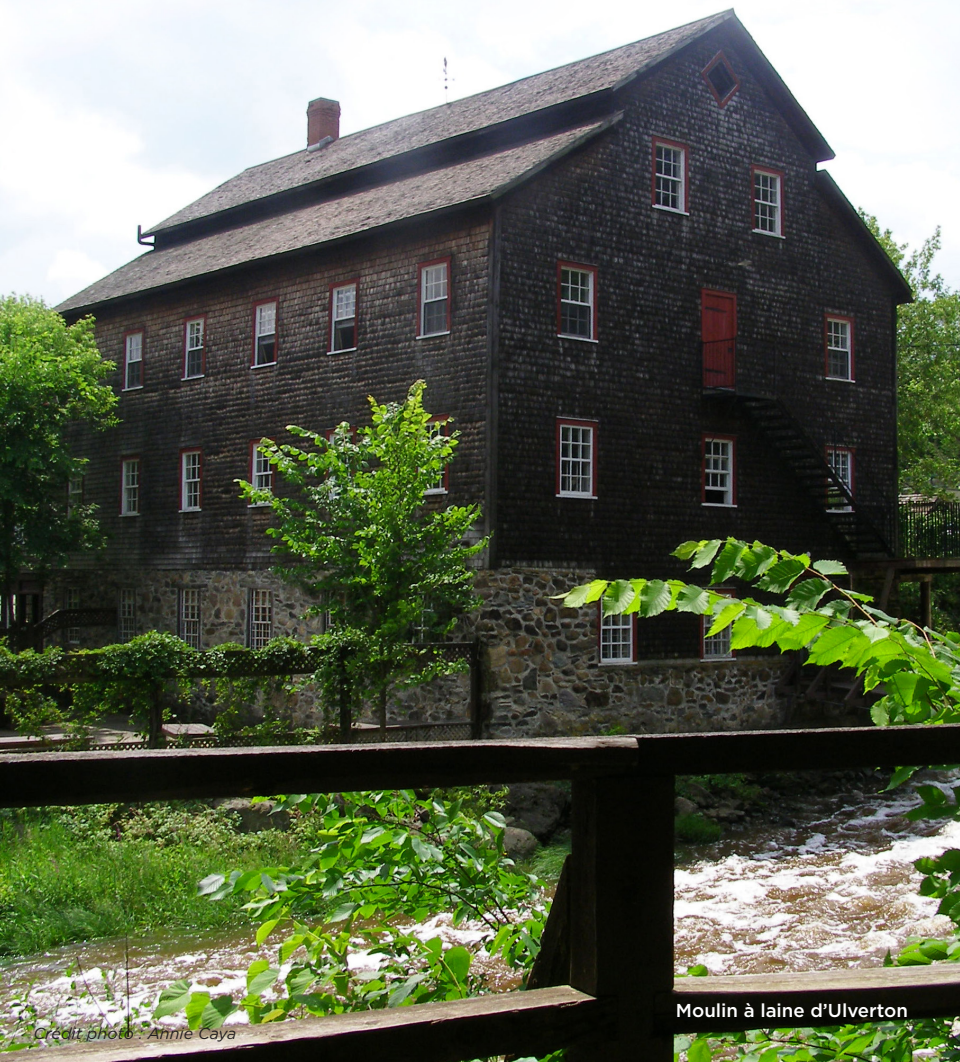
Moulin à laine d'Ulverton