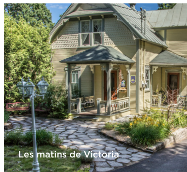
Les matins de Victoria

RETROUVEZ LES ADRESSES SUR ADDRESSES CAN BE FIND AT