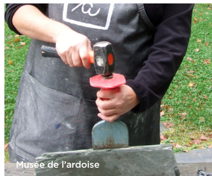
Musée de l'ardoise