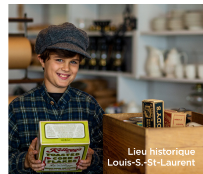
Lieu historique Louis-S.-St-Laurent