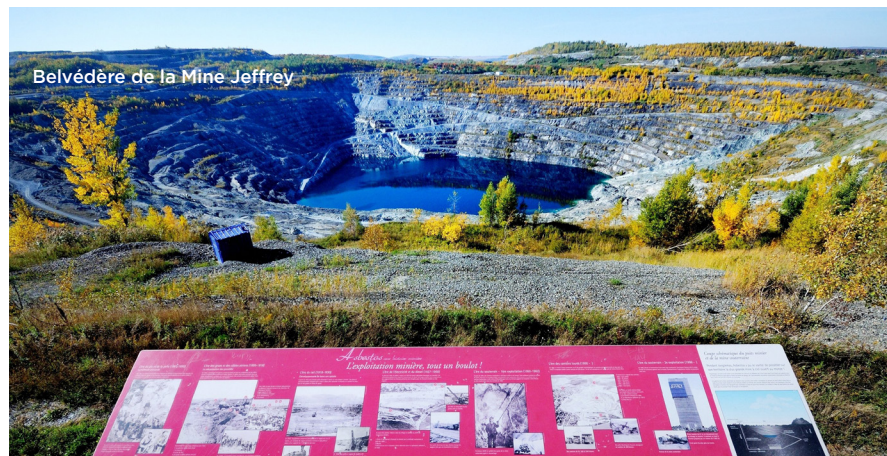
Belvédère de la Mine Jeffrey