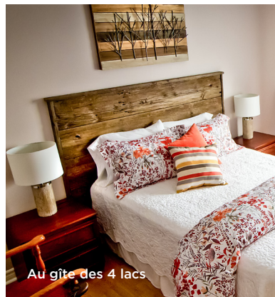
Au gîte des 4 lacs