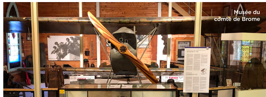
Musée du comté de Brome